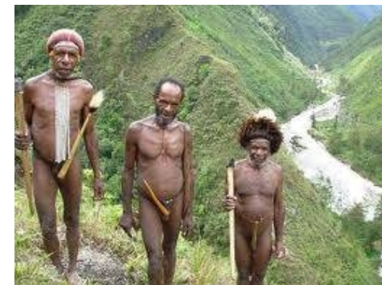
Papua's in het hoogland van Papua

Dit is een veel effectievere manier van werken dan wanneer buitenlandse zendelingen dit zelf in de binnenlanden van Papua proberen te doen.