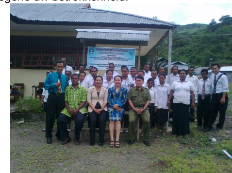
Staf van de Theologische Hogeschool STT Bethel