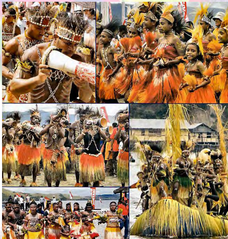
Danau Sentani Festival