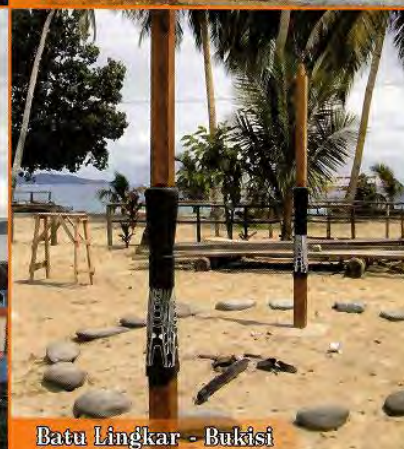
Batu Lingkar - Bukisi