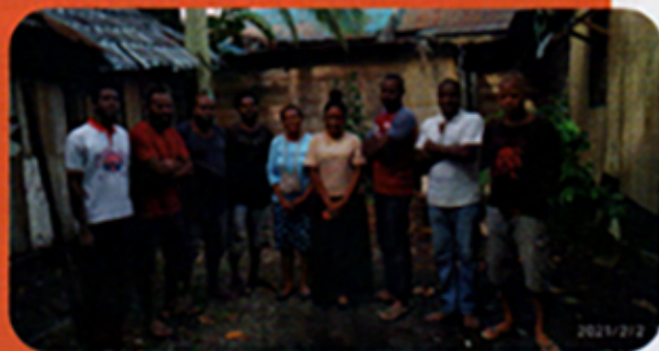
Nova en Irma bezoeken Yeri (rechts) en zijn huisgenoten in het asrama