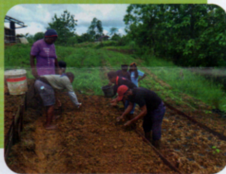
De deelnemers brengen de kennis meteen in praktijk