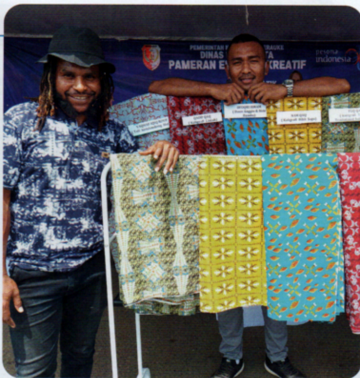
De batikstoffen worden o.m. verkocht op de pasar in Merauke