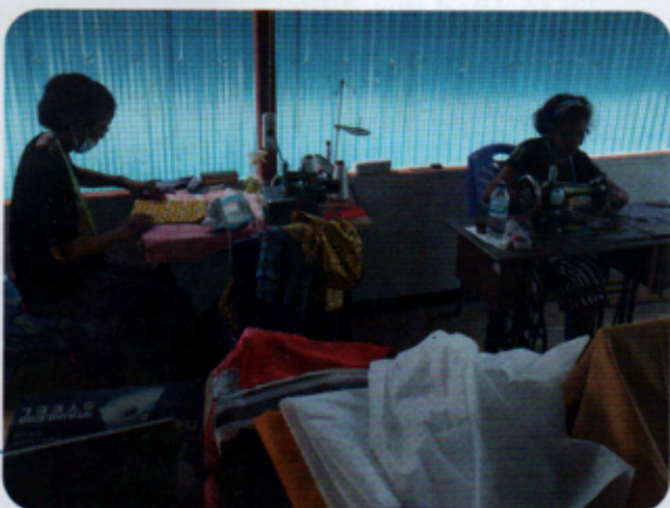
Asmat-vrouwen in Merauke maken kledingstukken op bestelling