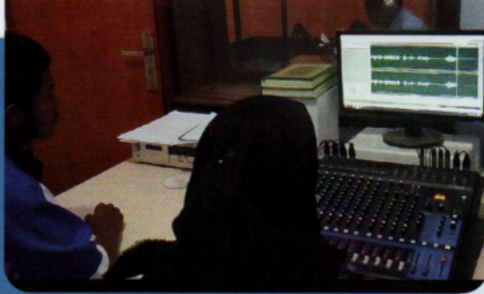
Opname van de radiofragmenten in de studio.

Radio is een gebruikelijk communicatiemiddel op Papua waarmee je, zeker tijdens een lockdown, mensen tot in hun huizen bereikt. Om een vervolg te geven op de advertentiecampagne, worden er verschillende