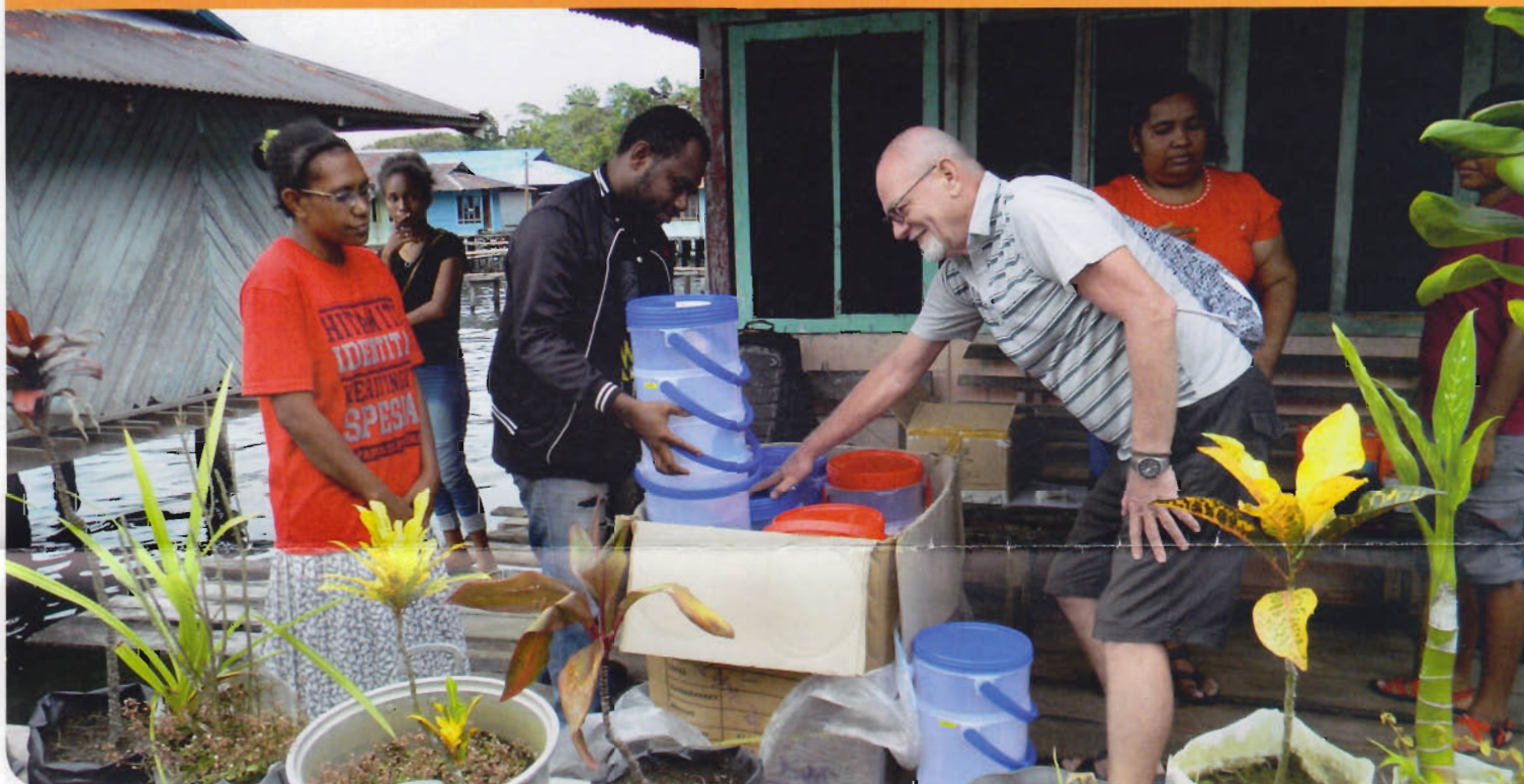
De nieuwe waterfilters voor de op het water gelegen kampong Tablasupa, worden uitgepakt

Het was groot feest op 19 november. De kampongs Amai, Tablasapu en Yepase in het district Depapre, ontvingen eindelijk waar ze Hapin dringend om hadden gevraagd. Alle dorpen ontvingen waterfilters en zonne-energielampen, en dat betekent schoon (drink)water, stroom en licht!