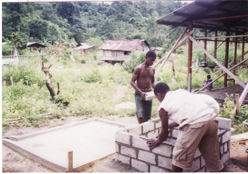
Werkzaamheden pomp in Udopi