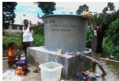
Oud en nieuw