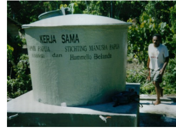
Dit is veel beter!