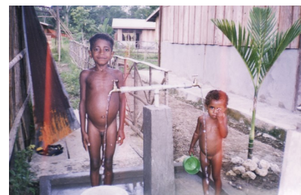
Nieuwe situatie in Inggramui; schoon water "voor de deur"