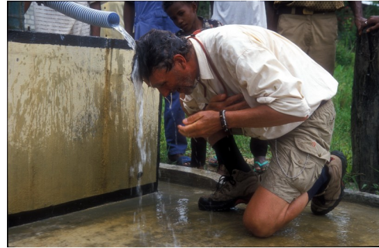
Nieuwe situatie Udopi