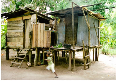
Woningen in Pami