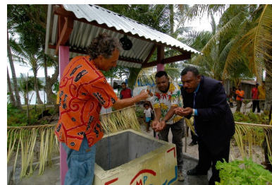
Ceremonie bij de overdracht