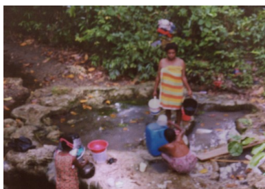
Oude situatie Breimi

Om dit probleem op te lossen is een bron in de heuvels achter het dorp uitgegraven. Bij de bron is een verzamelbak gebouwd. Van daaruit wordt het water via een stelsel van pijpleidingen naar het dorp geleid. Het water wordt daar opgevangen in een container met tapkranen. De inwoners hebben nu continue de beschikking over schoon water in het dorp.