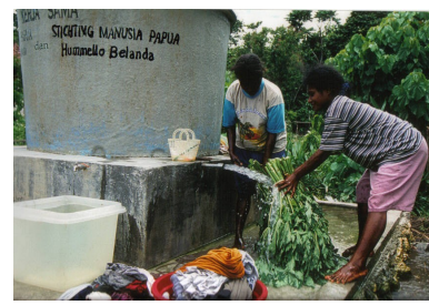
Nieuwe situatie Breimi