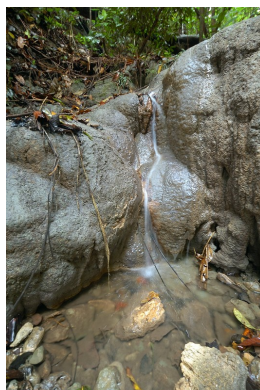
Oude situatie Inggramui

De enige waterbron in dit dorp is een riviertje waarvan de kwaliteit van het water negatief wordt beïnvloed door het gebruik stroomopwaarts en het seizoen. Verontreiniging, te weinig, teveel en vervuiling door zware regens, zijn veroorzakers van veel ongemak en ziekten. Om dit probleem op te lossen is een bron in de heuvels achter het dorp uitgegraven. Bij de bron is een verzamelbak gebouwd. Van daaruit is het water via een stelsel van pijpleidingen naar het dorp geleid. Het water wordt daar opgevangen in een container met tapkranen. De inwoners hebben na realisatie continue de beschikking over schoon water in het dorp.