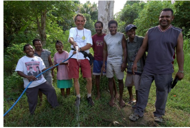
Afscheid oude waterslang